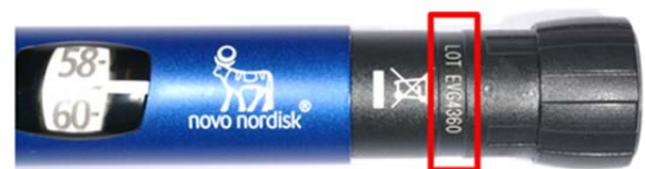
Abbildung 1. Die roten Markierungen zeigen an, wo die Chargennummern auf dem A) NovoPen Echo und B) NovoPen 5 zu finden sind. Zum Beispiel: Die Chargennummer des NovoPen Echo links ist FVG7364.

Patientinnen und Patienten im Besitz eines NovoPen Echo und/oder NovoPen 5 Insulinpens mit einer anderen als der oben angeführten Chargennummer haben keinen Grund zur Sorge und können darauf vertrauen, dass der Pen ordnungsgemäß funktioniert.